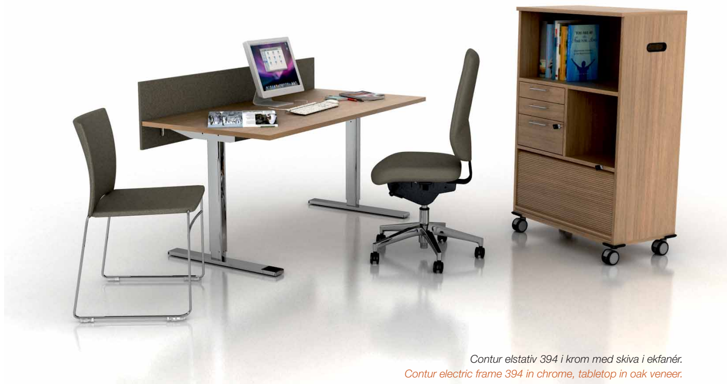
Contur elstativ 394 i krom med skiva i ekfanér. Contur electric frame 394 in chrome, tabletop in oak veneer.