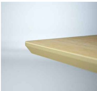
Profil 1 - 23 mm mdf fasad kant. Profile 1 - 23 mm mdf bevelled edge.