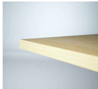
Profil 6 - 23 mm mdf rak kant, ABS dekorlist. Profile 6 - 23 mm mdf straight edge with ABS strip.