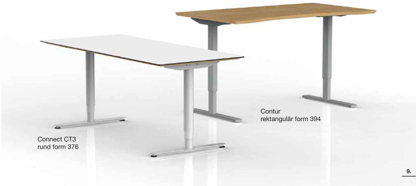
Connect CT3 rund form 376

As standard, all electric stands are delivered with a single controller, which is assembled under the table top. There is an additional controller with display that shows the height. The controller with display, recessed in the table top, is available as an additional option (not for DUO).