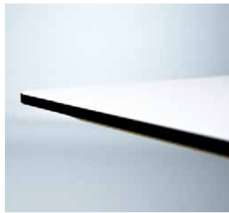
Profil 4 - ECP, 23 mm mdf fasad kant, ABS dekorlist. Profile 4 - ECP, 23 mm mdf, bevelled edge with ABS strip.