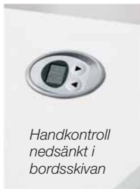
Handkontroll nedsänkt i bordsskivan